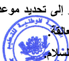
النقابة الوطنية للتعليم FDT الكاتب العام الرغويي الصادق