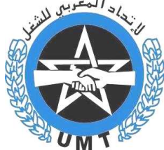
الجامعة الوطنية للتعليم UMT