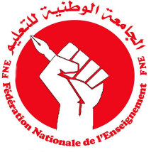
الجامعة الوطنية للتعليم FNE