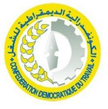
النقابة الوطنية للتعليم CDT