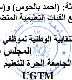
الجامعة الحرة للتعليم UGTM