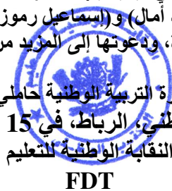
النقابة الوطنية للتعليم FDT