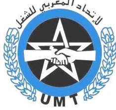
الجامعة الوطنية للتعليم UMT